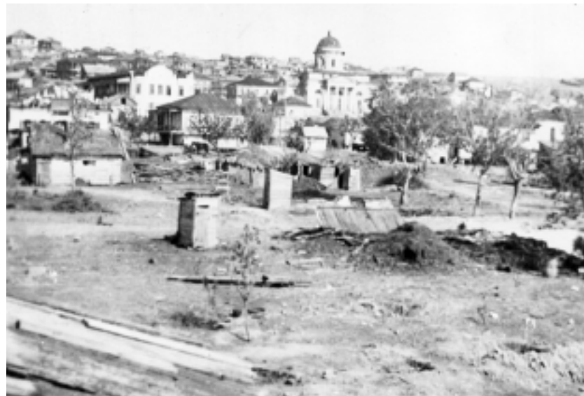
Цимлянская Молога. Решение уже (1948 год) принято. Станица Цимлянская должна судьбу Мологи (Рыбинское водохранилище) повторить

19 июля бомбёжка станицы прекратилась, и в наступившей тишине жители увидели, как по каменному спуску, построившись в колонну, как на параде, в станицу вошел немецкий отряд. Впереди знаменосца с развёрнутым красным знаменем шел