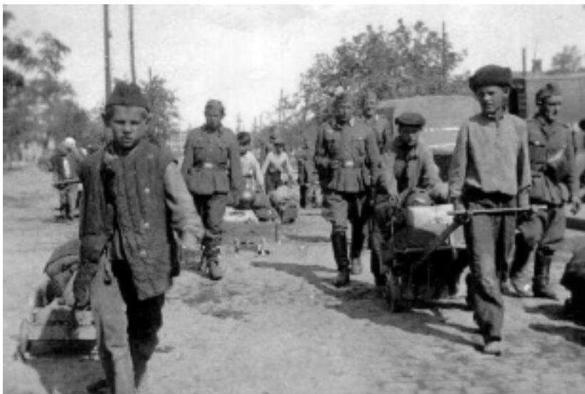
Лето 1942 года. В край донской оккупанты пришли.