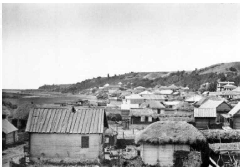
Станица Цимлянская.