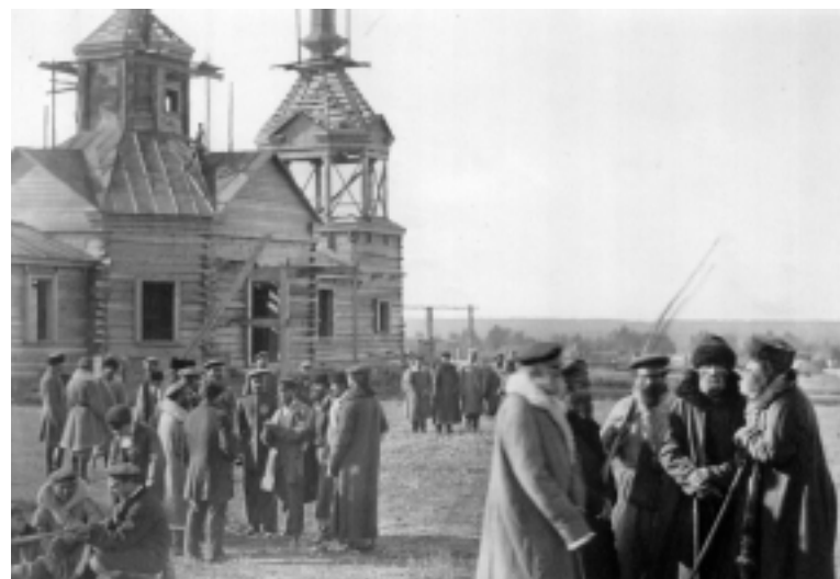
Сбор казаков в х. Нижнем Гнутове Есауловской станицы