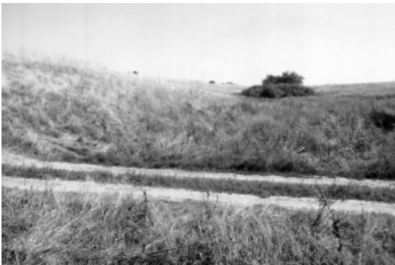
Балка Манюткина в своём начале. Разрезая хутор Колотовку пополам, она впадала в речку Цымла