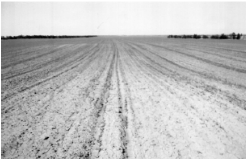
Немецкий полевой аэродром около хутора Протопоповского. Отсюда во второй половине 1942 года немецкие самолеты летали бомбить Сталинград, станицу Цымлянскую